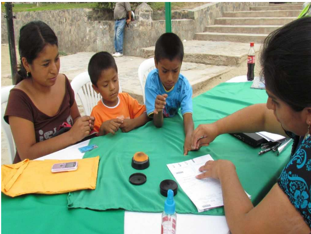
Campaña de DNI