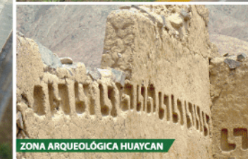
ZONA ARQUEOLÓGICA HUAYCAN