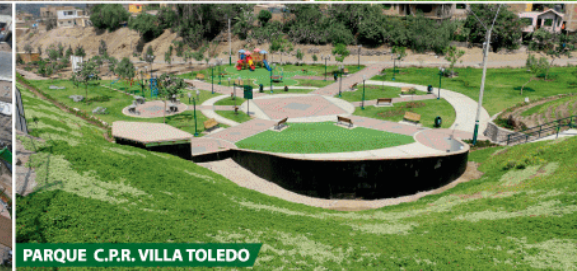
PARQUE C.P.R. VILLA TOLEDO