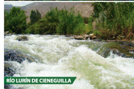
RÍO LURÍN DE CIENEGUILLA