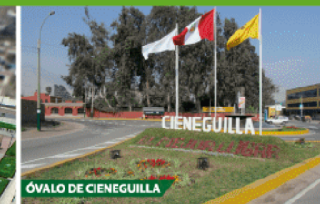
ÓVALO DE CIENEGUILLA