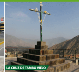
LA CRUZ DE TAMBO VIEJO