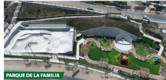
PARQUE DE LA FAMILIA