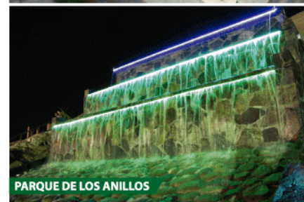
PARQUE DE LOS ANILLOS