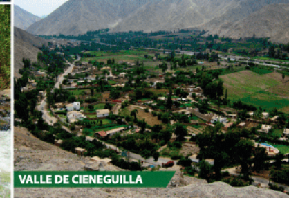
VALLE DE CIENEGUILLA