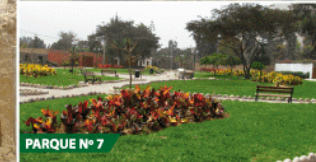
PARQUE N° 7