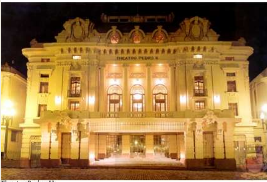
Theatro Pedro II