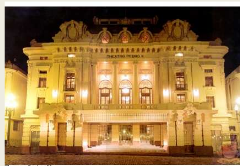
Theatro Pedro II